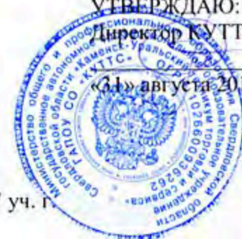
График проведения промежуточной аттестации в группах очной формы обучения в I семестре 2016-2017 уч. г. Отделение технологий и сервиса